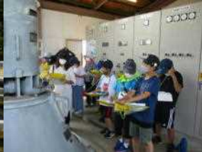
【5年 土地改良区見学】