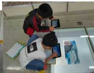
【6年 県立博物館見学】

県立博物館には一人一台タブレットを持参しました。展示物のQRコードを読み取り、説明をDLして詳しく調べました。