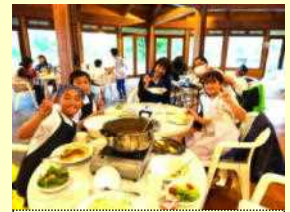
【自作カレーで夕食】

初日に同行しましたが、あいさつを元気にできていたところがとても良かったと思います。この宿泊体験学習で学んだことを、この後の学校生活に生かしていくことを期待しています。